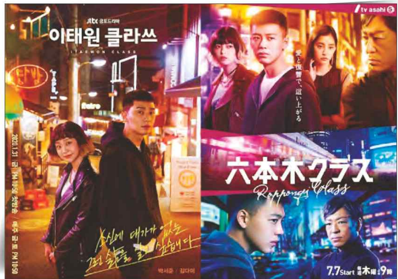
드라마 『이태원 클라쓰』. 일본에서 「롯폰기 클라쓰」로 리메이크 되는 등 큰 인기를 끌었다.

많은 사람들이 자신의 가치관을 ‘현실’이라는 ‘장벽’에 맞춰 타협하며 살아가고 있다.(…) 하지만 그렇게 타인과 세상을 맞춰 가는 삶이 정말 잘 사는 삶일까? 누구를 위한 삶인가? 삶에서 제일 소중한 것은 자기 자신이어야 하지 않을까? 당신의 삶에 당신은 있는가?