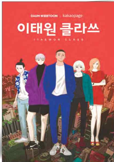
웹툰 『이태원 클라쓰』. 일본 웹툰 사이트에서 베스트 작품으로 인기를 끌었다.

1 다음에 제시된 우리 웹툰과 드라마가 세계적으로 사랑을 받게 된 이유를 작품에 담긴 ‘성장 서사’를 중심으로 생각해 봅시다.